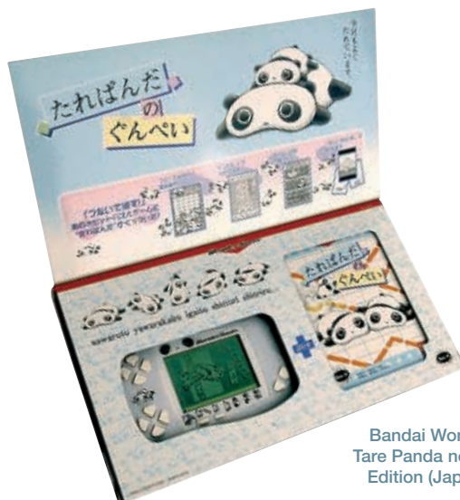
Bandai Wonderswan Tare Panda no Gunpey Edition (Japan, 2001)